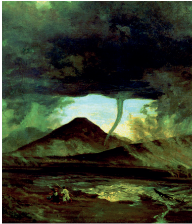
Imagen Tempestad en los llanos de Aragón

Intención: Recopilar aquellas prácticas que impactan negativamente al medio ambiente para modificar nuestro estilo de vida.