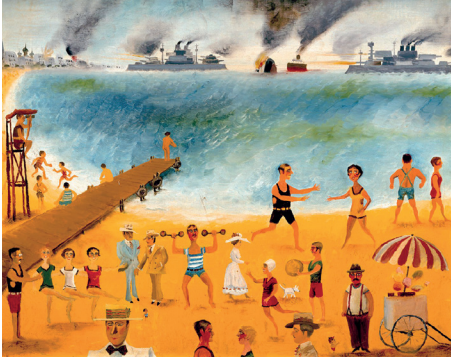
Bombardeo de Odessa, de Abel Quezada

Intención: Analizar la importancia de la toma responsable de decisiones para promover el bienestar individual y colectivo.