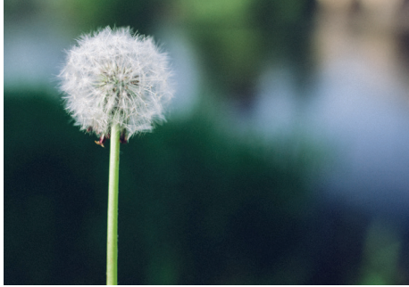
Just breathe (video)

Intención: Desarrollar la habilidad de controlar las propias emociones para prevenir los efectos perjudiciales de las mismas.